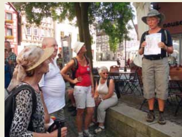
Ortskundige Pilgerleiterin mit Gruppenführung