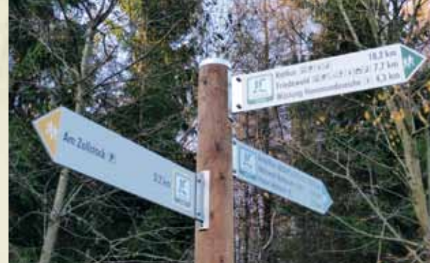
Wegweiser und Infobeschilderung am Wegerand