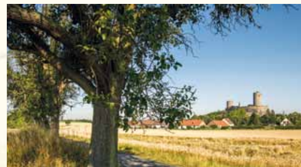
Burg Münzenberg in Mittelhessen

Die Reise Luthers und ihre Auswirkungen auf die Reformation waren Anlass, den Lutherweg 1521 im Rahmen des Reformationsjubiläums als Wanderweg auszuweisen. Der Verein Lutherweg in Hessen e.V. möchte so das historische Ereignis erlebbar machen.