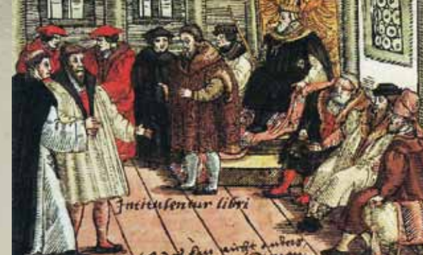
Luther auf dem Reichstag zu Worms. Holzschnitt von 1557

Für Gruppen bieten ausgebildete Pilgerleiter kundige und spirituelle Führungen über ausgewählte Wegeabschnitte an. Den Kontakt zu den Pilgerleitern vermittelt die Geschäftsstelle des Vereins Lutherweg in Hessen e.V. in Romrod. Mit dem Pilgerpass können Gäste an einzelnen Stationen des Lutherwegs 1521 Stempel sammeln und so eine schöne Erinnerung an den Weg bewahren.