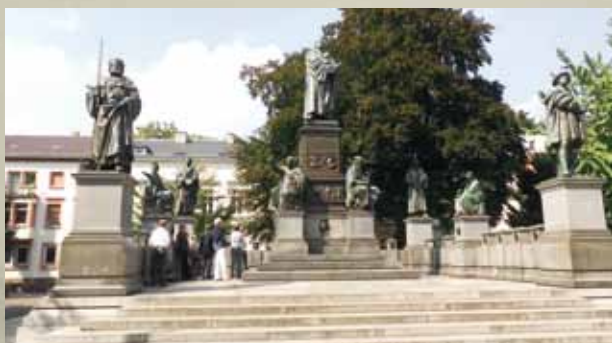
Das Lutherdenkmal in Worms

Heute steht der Weg als Symbol für den Wandel vom Mittelalter zur Neuzeit. Der Lutherweg 1521 ist ein Angebot für Pilger und Wanderer, die an der Reformation und deren Auswirkungen interessiert sind, aber auch für diejenigen, die Erholung und Entspannung vom Alltag suchen. Der gut ausgeschilderte Weg folgt den Spuren des Reformators, er verbindet historische Orte und erlebnisreiche Landschaften. So wird jahrhundertealte Glaubensgeschichte spannend und hautnah erlebbar.