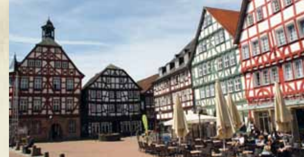
Marktplatz in Grünberg

Nicht immer ist Luthers Reiseroute historisch klar überliefert. In Mittelhessen bietet der Weg daher eine Besonderheit. Zwischen Friedberg und dem