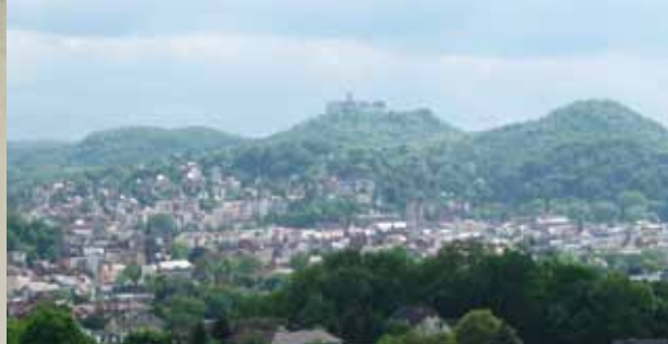
Eisenach mit der Wartburg